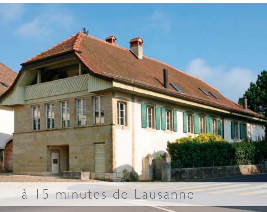
à 15 minutes de Lausanne

Voici une chance qui s'offre à vous: occuper une ancienne demeure de bailli, se plonger dans un esprit bourgeois et romantique ravissant. Cette bâtisse, rénovée avec soin à l'aide de matériaux de première qualité, date du XVIIIème siècle. Aujourd'hui, elle offre toujours le charme des vieilles pierres et le marie délicatement avec une modernité lumineuse et confortable.